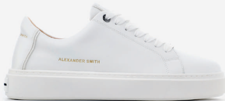
AW N2U TWT TOTAL WHITE