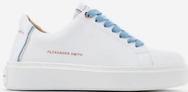
AW N2D 75 WAV WHITE AVIO

Per un cliente che vuole evidenziare la propria unicità.